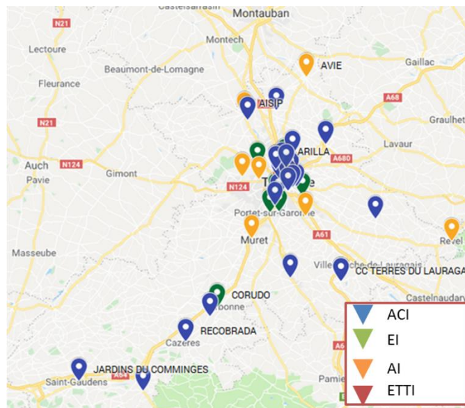
Type de SIAE

Les Association intermédiaire constituent également une part importante du tissu insérant hors métropole. Ce modèle reste cependant fragile. Les AI ont plus de difficultés à mobiliser les salariés pour la formation ou la mise en place de PMSMP que les ACI ou les EI.