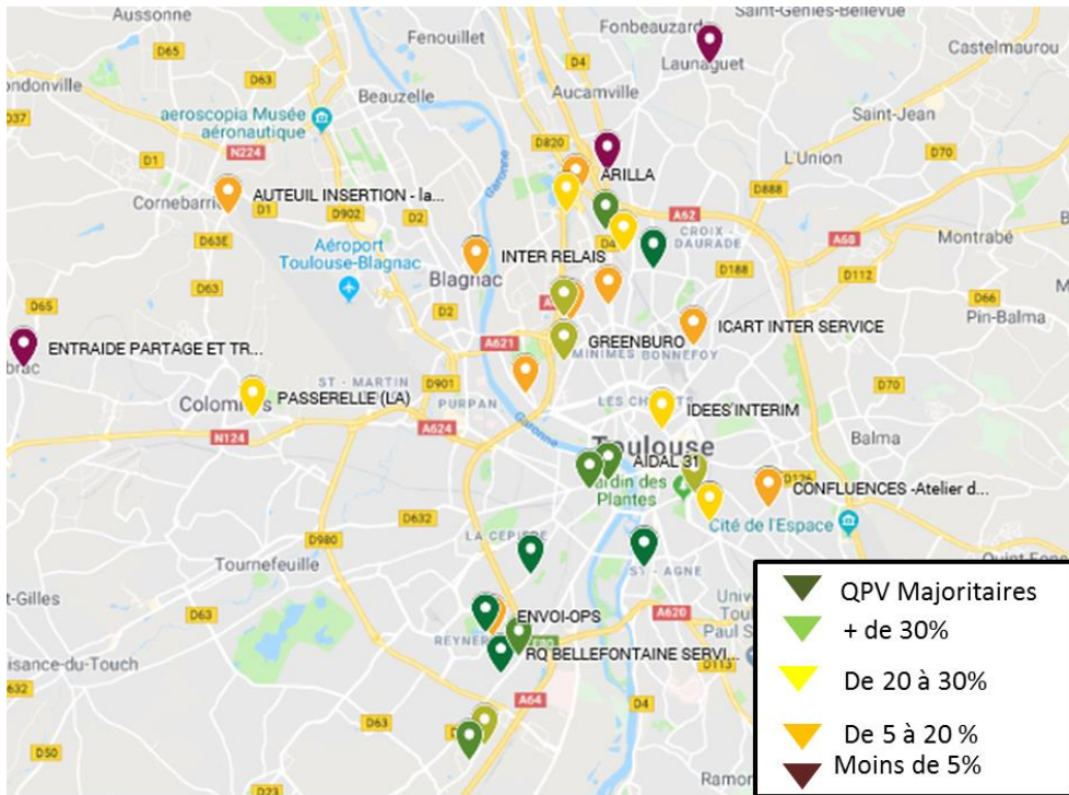
Part des QPV dans les recrutements 2017