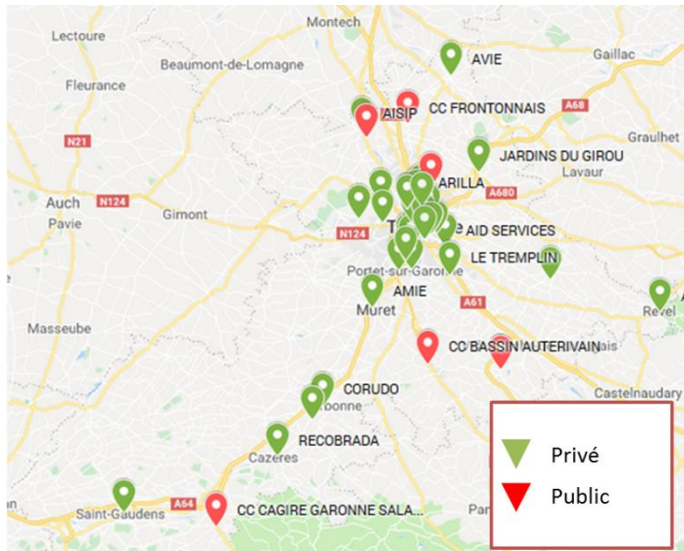
Poids des SIAE portées par un acteur public sur le territoire

Dans les zones hors métropole, une part significative de l'offre d'insertion repose sur les acteurs publics (en rouge sur la carte). Or, les salariés en insertion employés par une collectivité ont de réelles difficultés à bénéficier de formations. Ils sont exclus de la dynamique de formation impulsée par le PIC IAE.