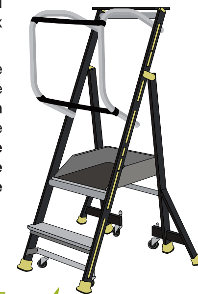
PLATEFORME INDIVIDUELLE ROULANTE LÉGÈRE

Toutefois, ces équipements peuvent être utilisés en cas d'impossibilité technique de recourir à un équipement assurant la protection collective des travailleurs ou lorsque l'évaluation du risque a établi que ce risque est faible et qu'il s'agit de travaux de courte durée ne présentant pas un caractère répétitif ".