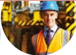
Technicien en hygiène et sécurité